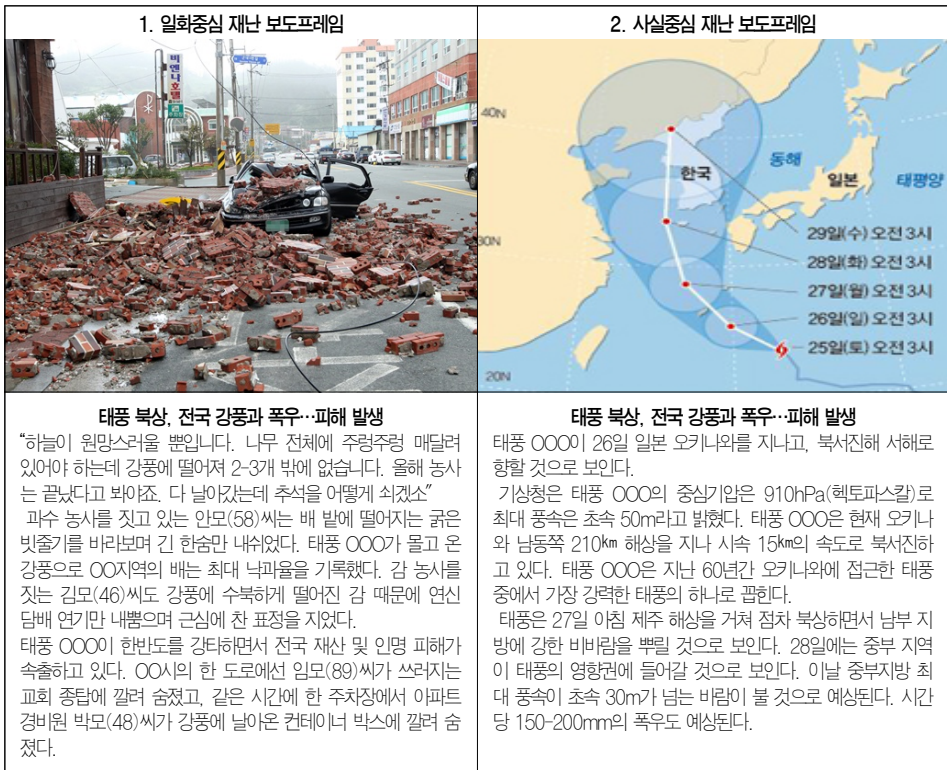
표 1. 실험 조건별 보도 프레임

일까지 태풍 블라벤 관련 기사를 검색했다. 기사 검색 대상으로 태풍 블라벤을 선택한 이유는 2012년 당시 블라벤은 태풍의 강도뿐만 아니라 진로 예측에도 문제가 있었으며, 이와 관련해 사회적으로 이슈화되었기 때문이다. 2) 이에 본 연구는 태풍 블라벤 관련 기사가 여러 유형으로 제시됐다는 것을 참고해 검색을 실시했다. 검색 키워드는 ‘태풍 블라벤’, ‘태풍 블라벤 피해’, ‘태풍 블라벤 영향’ 등이었다. 검색된 기사들 중 과학적 발견, 숫자, 지도 등이 포함돼 있고 태풍의 진로를 사실적으로 서술하는 기사는 사실중심 재난 보도프레임으로, 태풍으로 인한 사회 경제적 피해, 피해를 입은 인터뷰 대상자의 감정적 경험을 보여주는 기사는 일화중심 재난 보도프레임으로 구분했다(〈표 1〉).