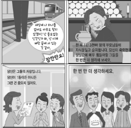
규범적 내용 * 텍스트 형식